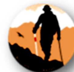
BLIND MAND I CAMINOLAND