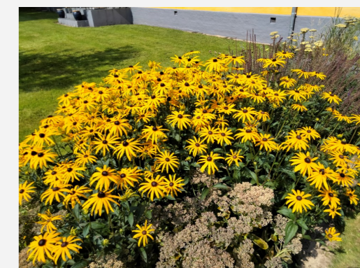
Staudebed ved sognegården