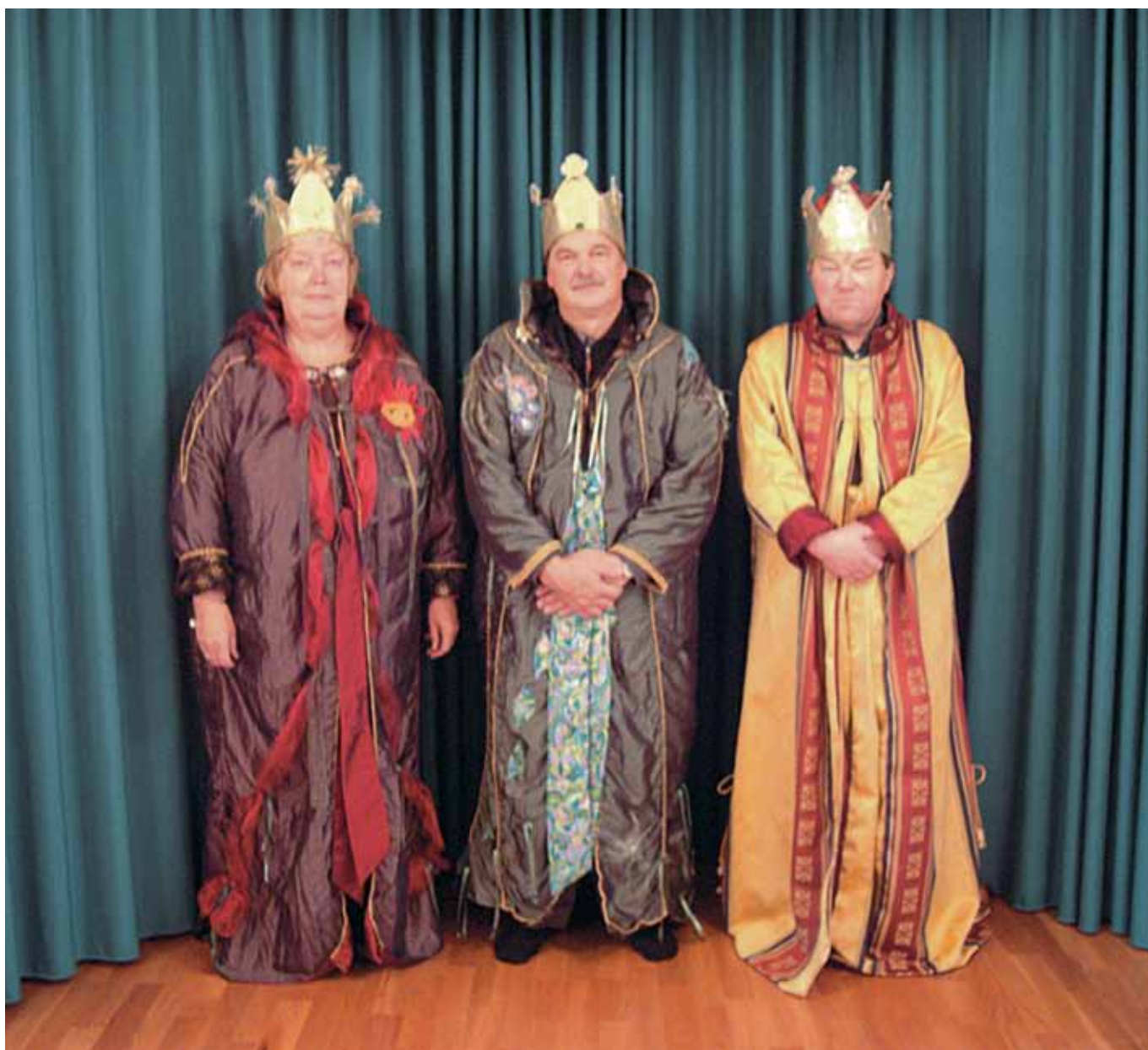
De hellige tre konger.